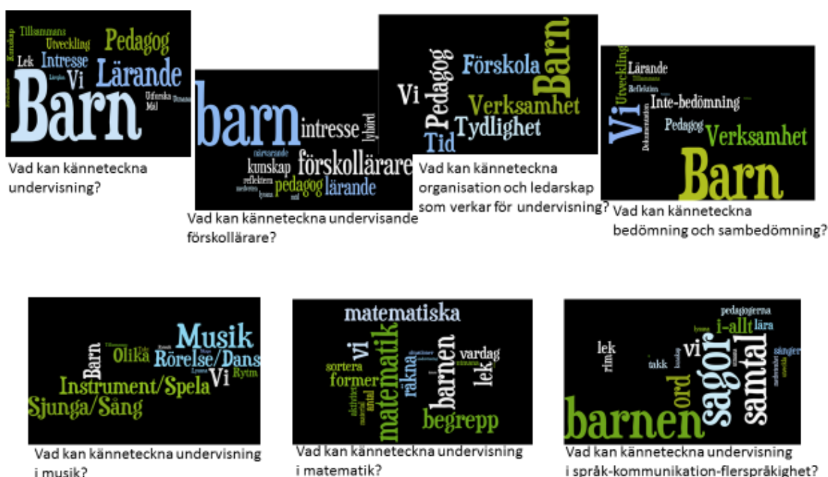
Figur 1: Ordmoln med högfrekventa ord i förhållande till delfrågor i rapporten

Utfallet av högfrekventa ord i förhållande till delfrågor i rapporten illustreras i figur 1.